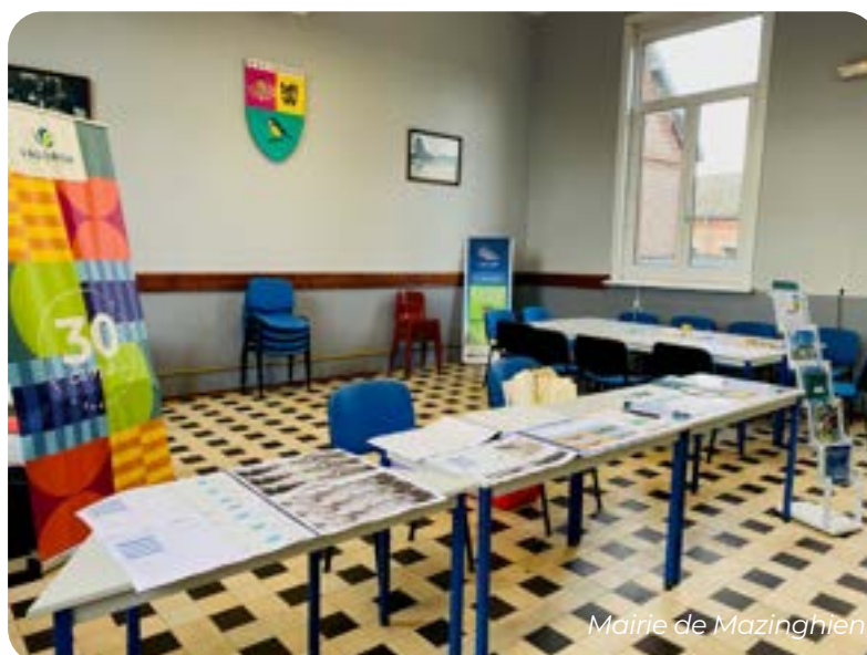
Mairie de Mazinghien

Les habitants ont alors pu s'informer et échanger sur le projet . Des invitations avaient été distribuées dans toutes les boîtes aux lettres de Mazinghien.