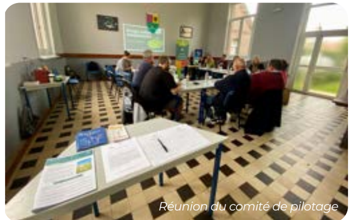
Réunion du comité de pilotage

Cette réunion a été l'occasion pour le bureau d'études AUDDICE, mandaté par VALOREM, de partager les résultats des états initiaux des études écologiques (faune et flore) menées depuis novembre 2024.