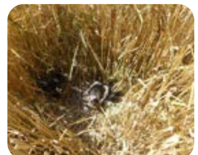
Nid de busard cendré